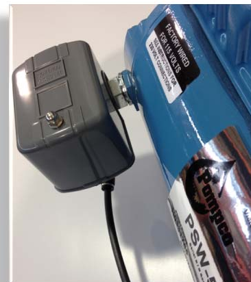
Figure 1: Emplacement de l'interrupteur de pression